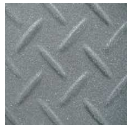
*2 高防滑 加工イメージ(オプション)

*1 「ダブル止水ユニット」連続止水材床版取付型の〈A工法〉と連続止水材本体取付型の〈B工法〉の2タイプから選べます。