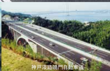
神戸淡路鳴門自動車道