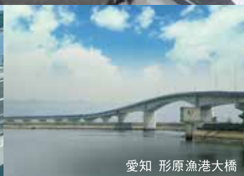
愛知 形原漁港大橋