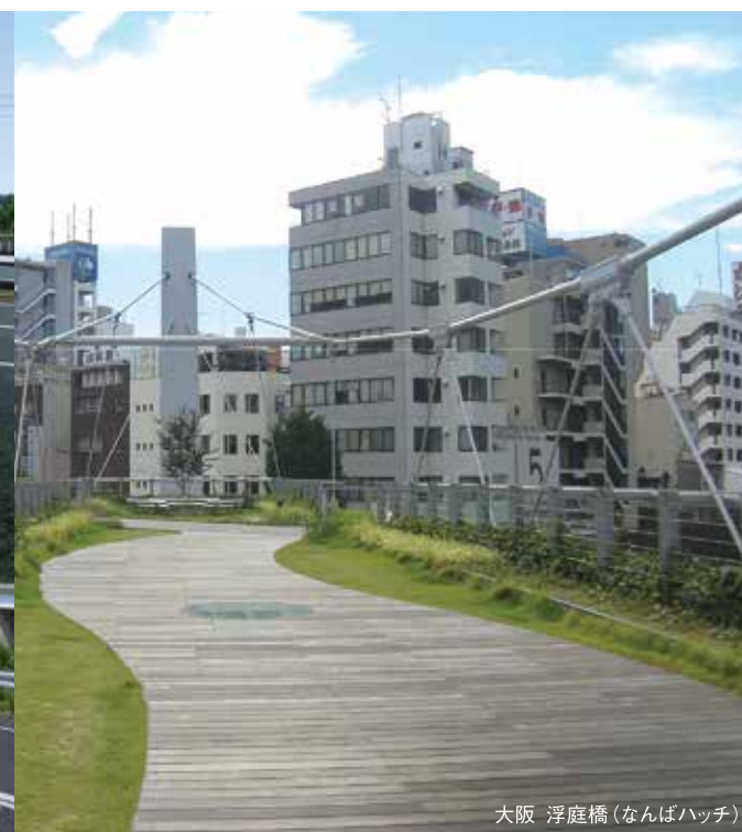
大阪 浮庭橋(なんばハッチ)