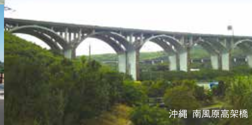
沖縄 南風原高架橋