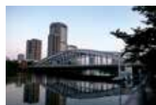
大阪 桜宮橋 大阪市の国道1号、大川に架けられた3ヒンジアーチ橋。(1930年建設。「銀橋」の愛称で親しまれる。)