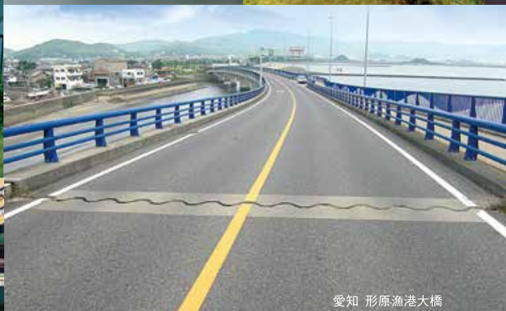
愛知 形原漁港大橋