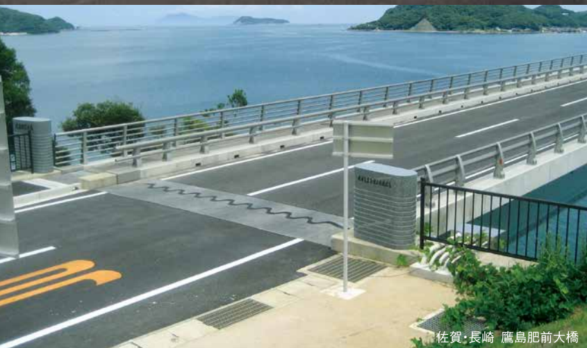
佐賀・長崎 鷹島肥前大橋