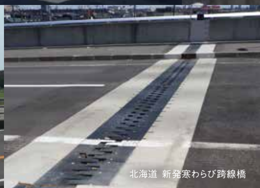
北海道 新発寒わらび跨線橋