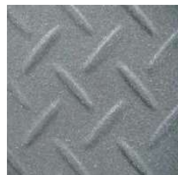
*2 高防滑 加工イメージ(オプション)

*1 「ダブル止水ユニット」連続止水材床版取付型の(A工法)と連続止水材本体取付型の(B工法)の2タイプから選べます。