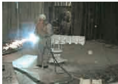
アルミニウム マグネシウム合金溶射