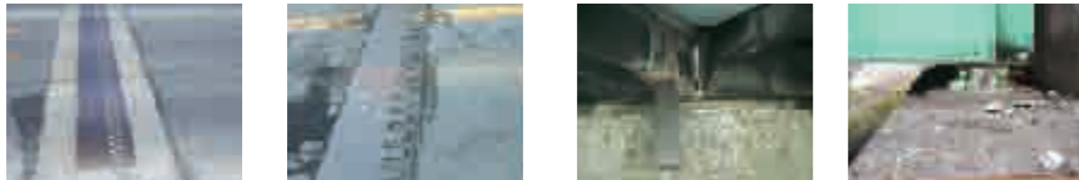
平成19年10月「寒冷地における伸縮装置の調査開発検討業務報告書」より